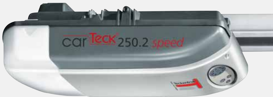
CarTeck Antrieb 250.2 „speed“: Öffnet schneller als herkömmliche Antriebe.