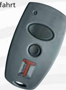
„Mini“ 2-Kanal- Handsender