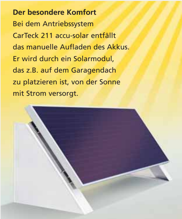
CarTeck 211 Akku-Solarmodul: Einfach zu befestigen. Maße: 585 x 340 x 225 mm, Gewicht: 4,3 kg.

Bei dem Antriebssystem CarTeck 211 accu-solar entfällt das manuelle Aufladen des Akkus. Er wird durch ein Solarmodul, das z.B. auf dem Garagendach zu platzieren ist, von der Sonne mit Strom versorgt.