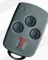
„Mikro“ 3-Kanal- Handsender

Mit jeder zusätzlichen Taste der Mehrkanal-Fernsteuerung können z.B. ein zweites Garagentor, das Hoftor oder die Beleuchtung in der Einfahrt gesteuert werden.