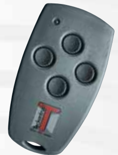
„Mini“ 4-Kanal- Handsender